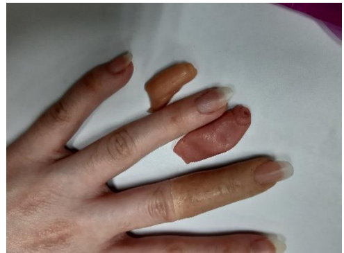
การเทียบสีผิวและสีเล็บก่อนการผลิตอุปกรณ์จริง

อายุการใช้งานของอุปกรณ์เทียมซิลิโคนอยู่ที่ระยะเวลาประมาณ 2-3 ปี ขึ้นอยู่กับลักษณะการใช้งาน ถ้ากิจกรรมที่ต้องใช้อุปกรณ์และมีการเสียดสีที่อุปกรณ์เยอะ เราแนะนำให้ใส่ถุงมือผ้าเพื่อยืดอายุการใช้งานของอุปกรณ์เทียมซิลิโคน