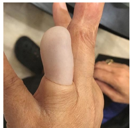
การทดลองใส่เข้าทดลองซิลิโคน

การทำเข้าลองสำหรับลองเพื่อให้เข้าซิลิโคนใส่พอดีและสบายกับต่อนิ้วที่สุด ตัวเข้าทดลองยังทำหน้าที่ในการทำให้ต่อนิ้วคงรูป ตัวเข้าทดลองเป็นสีธรรมชาติไม่มีสีหรือสีใส โดยปกติแล้วเราจะให้ลองใส่เข้าทดลอง 2-3 ขนาดก่อนการทำเข้าจริง ถ้าหากว่าคุณสามารถใส่เข้าลองได้นานทั้งวัน และใส่ได้พอดีนานกว่าสองสัปดาห์ขึ้นไปเพื่อให้แน่ใจว่าต่อนิ้วจะไม่เปลี่ยนรูปหรือขนาด หลังจากนั้นเราสามารถเริ่มกระบวนการการทำเข้าซิลิโคนจริงได้