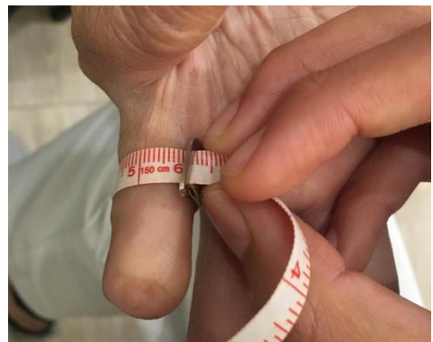
การตรวจประเมินและหล่อแบบและการวัดนิ้ว

# การรับบริการครั้งที่ 2 : การลองเข้าทดลองซิลิโคน